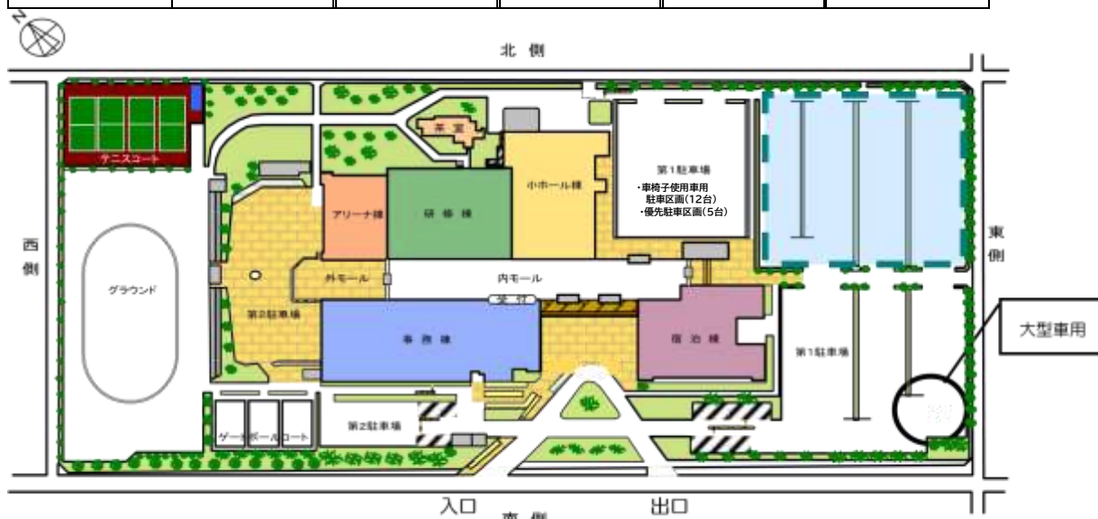
埼玉県県民活動総合センター 配置図