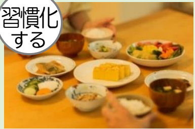
毎日の食事の見直し