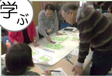
シニアライフに役立つ知識の習得