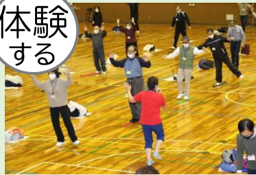
体幹を鍛えて転倒防止 スラックレール体験