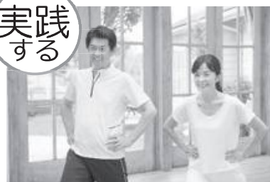
体力・脳力アップ