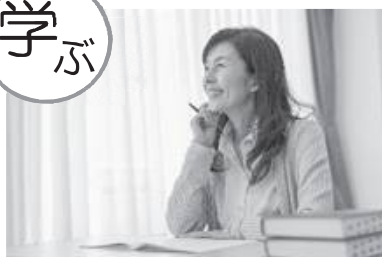
シニアライフに役立つ知識