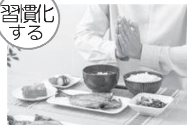
毎日の食事の見直し